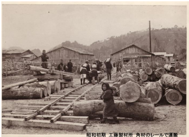
昭和初期 工藤製材所 角材のレールで運搬