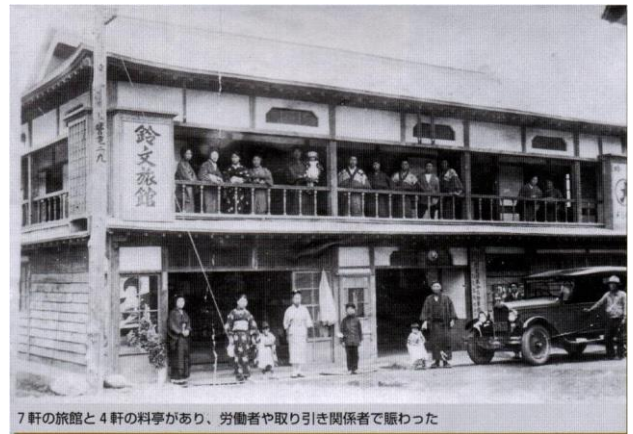
7軒の旅館と4軒の料亭があり、労働者や取り引き関係者で賑わった

大正から昭和初期、小本の沖に1000トン級の運搬船(蒸気船)が停泊し、それに舳で丸太、枕木、用材、耐火粘土などを積み込み、多くの雇用が生まれた。集落も拡大し、旅館7軒、料亭4軒など、活況を呈したが--。