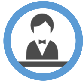
LA カウンターでの質問