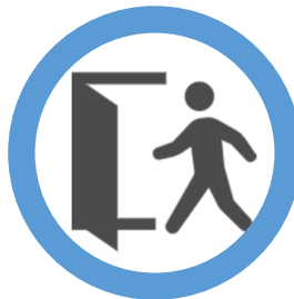
イベント途中離脱可能