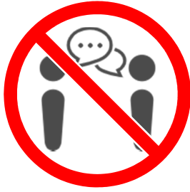
図書館内での会話禁止