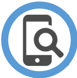
スマホ・本の検索可能