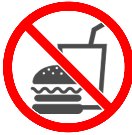
図書館内での飲食禁止