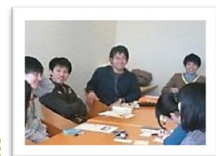
読書会の様子です♪