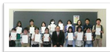
↑昨年度は、29名で活動しました。

図書館の利用促進に取り組んでいる学生ボランティアです。図書館内で利用案内、図書の企画展示、グッズ作成など様々な活動をしています。