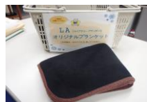
図書館カウンター前にあります

冷房が効きすぎて「寒い」と感じたときは、ブランケットの貸出を行っておりますので、どうぞご利用ください。