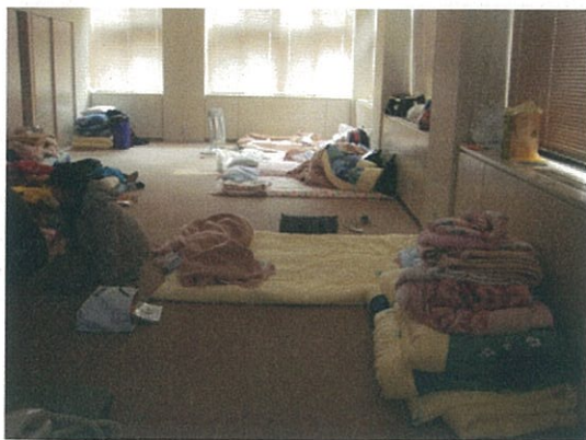
大学施設「地域ケア実習室」を使用した避難所

岩手県立大学健康サポートセンター職員もまた、震災直後の数日間は大学に泊まり込み医療専門職として避難してきた地域住民や学生に対応した。不安症状、睡眠障害、消化器症状や感冒様症状などを呈する避難者は少なくなかった。また、各学部の学生が近くのアパートなどから避難して来ており、大学施設での寝泊まりを続けていた。このような事態に対して、健康サポートセンターでは、医師、看護師、臨床心理士などの専門職が大学各学部など全学の施設を巡回し、心身の健康管理についての相談に応じた。この巡回の際に、各学の教職員から被災学生への対応に関する相談が数多くあった。中でもメンタル面での対応の難しさについての相談が多かった。巡回の回数を重ねるごとに、学生や教職員を含めて被災直後の恐怖や不安の心理状態から、しだいに落ち着きを取り戻していることが伺われた。また、大学構内に避難する学生の数は徐々に減っていった。しかし、中には被災の心的トラウマから立ち直れない学生がいるということも分かってきた。そして、教職員はそのような学生への対応に苦慮していることが伺われた。