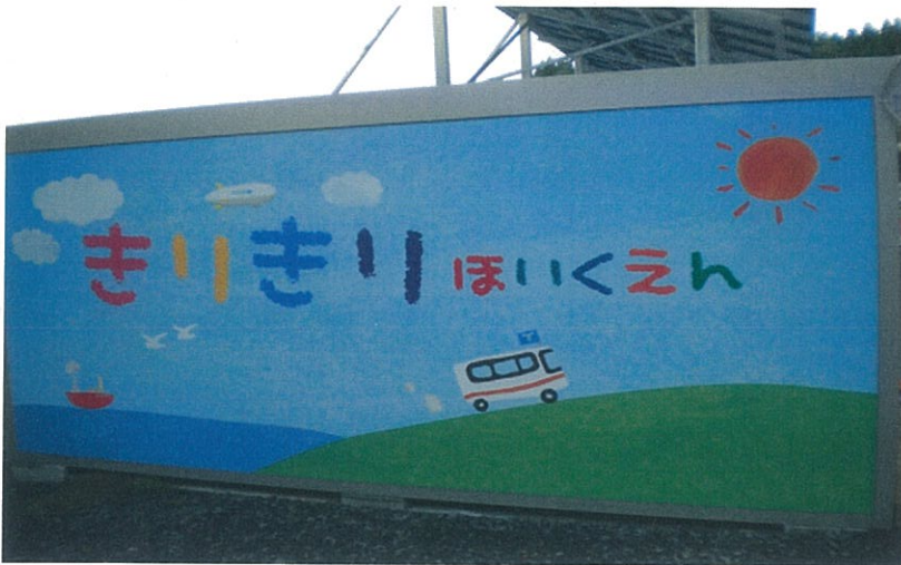
陸前高田市内保育所