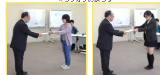
キックオフの様子

また、5月24日には、講師を招いてスキルアップ研修が行われました。これから活動するにあたり、図書館サービスに関する基礎知識を身につけるとともに、LAとしての役割について理解を深めることができ、充実した研修となりました。