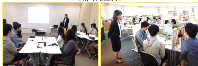
スキルアップ研修の様子