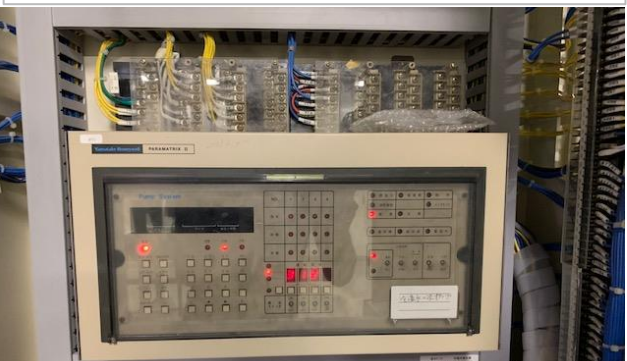
熱源管理用デジタルコントローラー(温水用) 現行使用製品:山武製 PARAMATRIX2