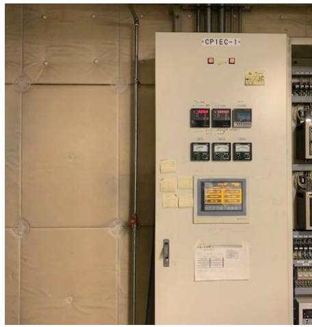
熱源機制御用シーケンサ