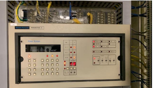
熱源管理用デジタルコントローラー(冷温水用) 現行使用製品:山武製 PARAMATRIX2