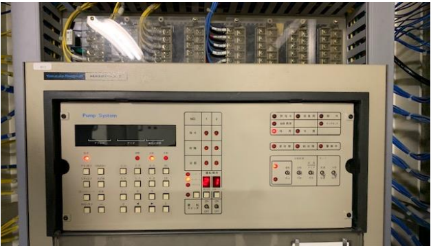
熱源管理用デジタルコントローラー(冷水用) 現行使用製品:山武製 PARAMATRIX2