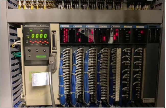
熱源管理用デジタルコントローター 現行使用製品:山武製 MX200