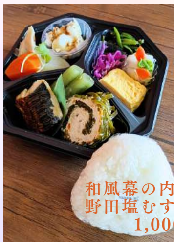
和風幕の内おかず& 野田塩むすびセット 1,000円