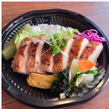
味噌漬け鶏のデリ弁当 800円