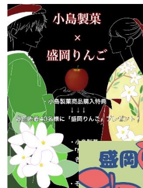
▲岩手県立大学「驚風祭」での盛岡りんごPR