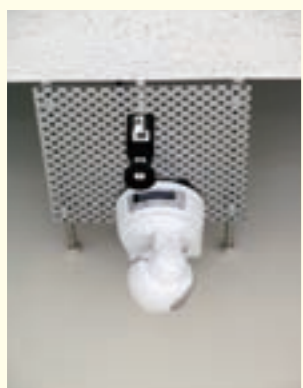
大学構内に試験設置されている全方位カメラとPTZカメラ