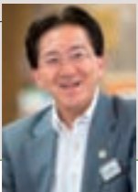
岩手県知事 達増 拓也

大学にはプラクティカル(実践的)であれということをお願いしたいが、県もよりアカデミック(学究的)にということが求められているのではないかと思います。県立大学の教員がどのような論文を書いているのか、県が関心を持つ必要がありますし、県が県民のニーズや研究のフィールドを紹介できると思います。また、大学の研究成果は、県民にとっても関心の高いものが多くありますから、今以上に公開、発表してもいいのではないのでしょうか。また研究成果を積み重ねていく中で、教育も充実していくのではないかと感じました。