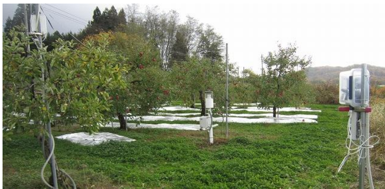
図3 農地の写真（紫波町）