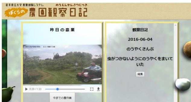
図5 農作業の閲覧画面