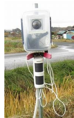
図4 人感センサ付きWebカメラ