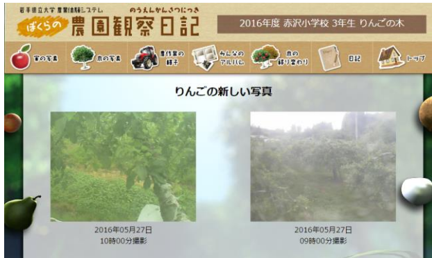
図1 農地モニタリングシステムの画面例