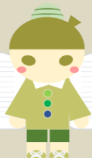
キャラクターもリニューアルしました