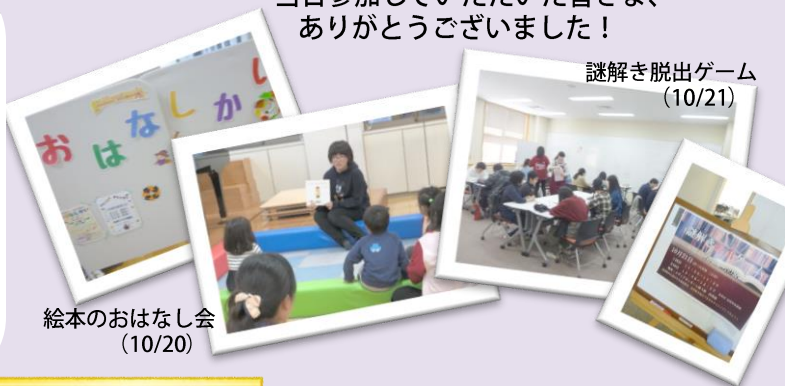
謎解き脱出ゲーム (10/21)