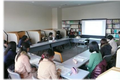
↑特別閲覧室でのプレゼンテーションの様子。ライブラリー・アテンダントの講習会です。

図書館で取り組んでいる「ラーニング・コモンズ」。先月号では「多目的スペース」についてご紹介しました。（先月号はHPより閲覧できます。）今月号では「グループ学習・個別学習スペース」についてご紹介します。