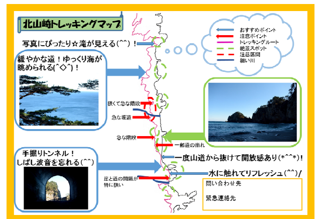
制作したトレッキングマップ