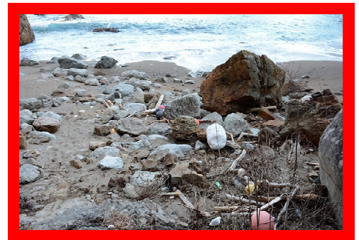
海岸のゴミが地域に積もる課題の多さを表す...