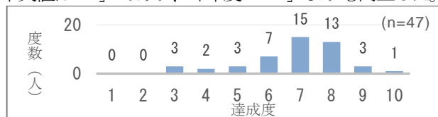
図 2：演習目標に対する学生自身の達成度