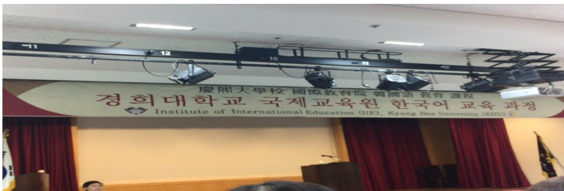
↑キョンヒ大学 入校式！午後はクラス分けテストでした。

初めての飛行機、初めての海外で本当にわくわくでした。韓国の仁川空港に着いたときからCAさんも看板も全て韓国語で韓国に着いたという実感が湧いたし、韓国語が全く話せない・読めない・書けない私は出発前よりも不安になりました。韓国に着いた夜に外食して3人とも韓国語ができなくて、携帯で調べたりわずかな知識をたどって解読したりして初日は大変でした。